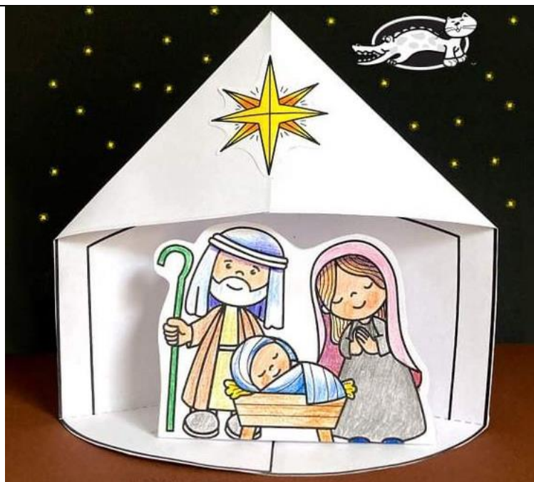
Descobrir a Sagrada Família - Para os mais novos: PINTAR E ARMAR na Catequese e em Família