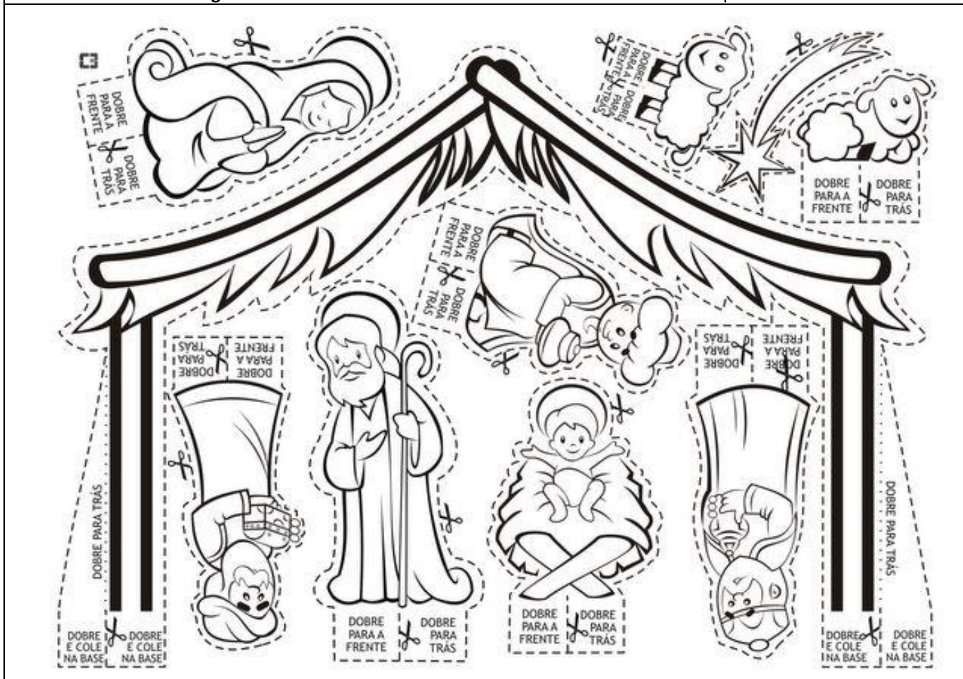
Descobrir a Sagrada Família - Para os mais velhos: PINTAR E ARMAR na Catequese e em Família